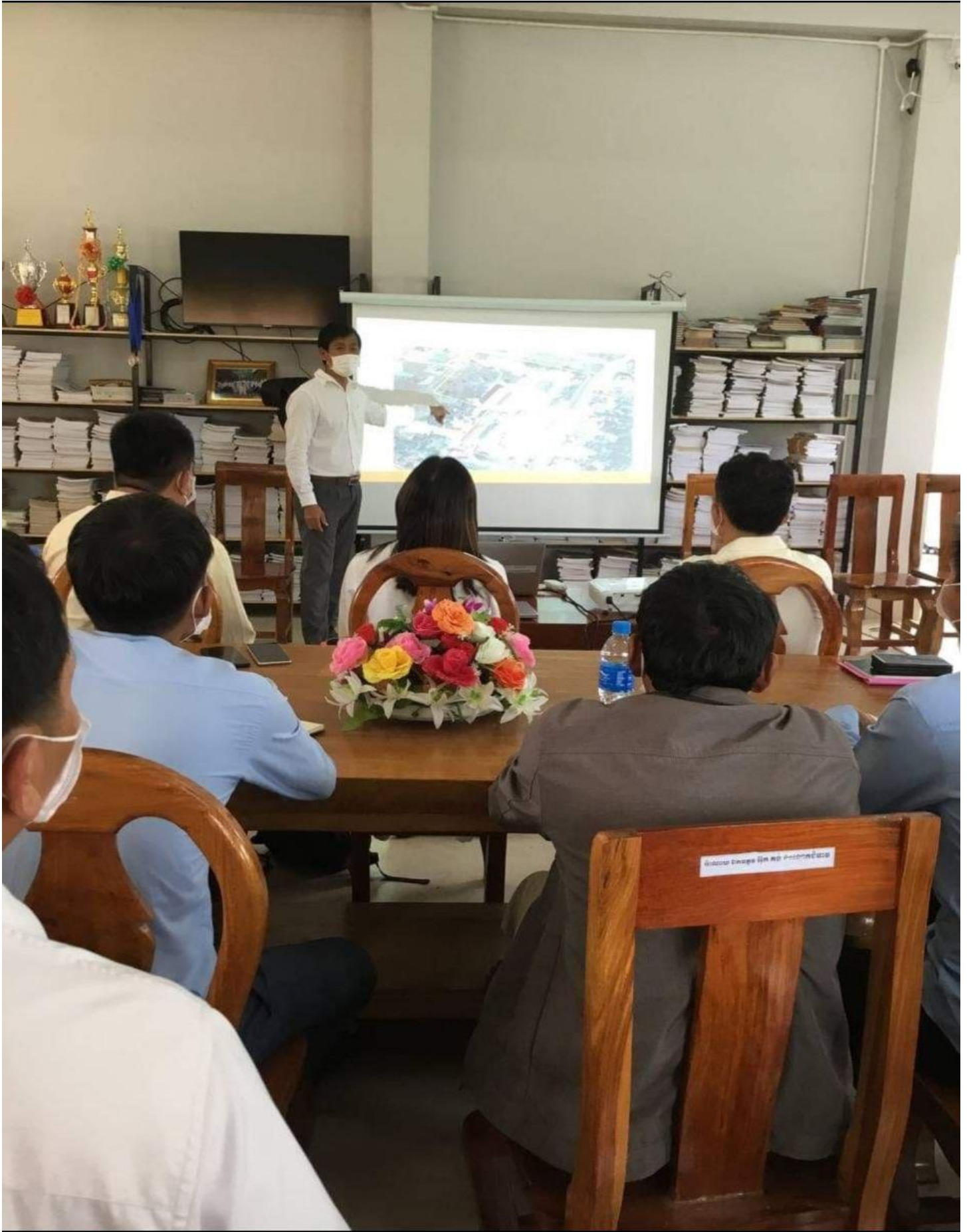
រូបភាពទី១: សកម្មភាពប្រជុំធ្វើផែនការយុទ្ធសាស្ត្រអភិវឌ្ឍន៍សាលារៀន